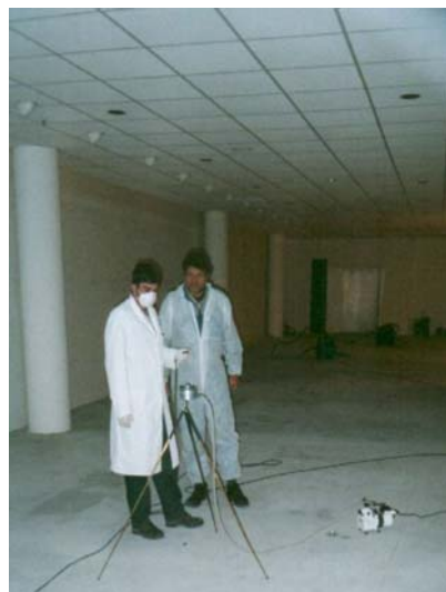
Abb.1: Messung der Luftkeimzahl mittels Luftkeimsammler

schlossen werden. Es wurde eine qualitative, quantitative und humantoxikologische Analyse der Raumluft des Verkaufsraumes im Erdgeschoss durchgeführt. Damit sollte die Belastung durch eventuell gewachsene Mikroorganismen in diesem Bereich eingeschätzt werden, da dieser sofort wieder genutzt werden musste. Es erfolgte eine Ermittlung der Schimmelpilzsporenzahl der Luft mittels Luftkeimsammler.