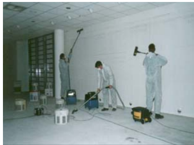
Abbildung 2: Reinigung der Raumbooberflächen mit geeigneten Saugern

mete Luftreiniger im Verkaufsraum und im Bereich oberhalb der Deckenkonstruktion zum Einsatz gekommen. Diese filtern aus der Luft alle Partikel >300 nm heraus. Darunter fallen alle Pilz- und Bakteriensporen. Damit konnte die Luftbelastung drastisch (siehe Abbildung 3) verringert werden. Nun wurden alle Wand-, Decken- und Fußbodenoberflächen der Halle akribisch von diversen Schimmelpilzsporen gereinigt. Dazu haben Industriestaubsauger (Staubklasse H + Asbest) Verwendung gefunden (siehe Abbildung 2).